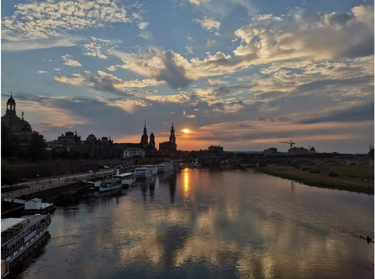
Dresden am Abend

Auch in Pandemiezeiten werden Kinder geboren. Heute beispielsweise im Kreiskrankenhaus Freital. Lina Tabea erblickte mit den letzten Sonnenstrahlen des Tages das Licht der Welt.